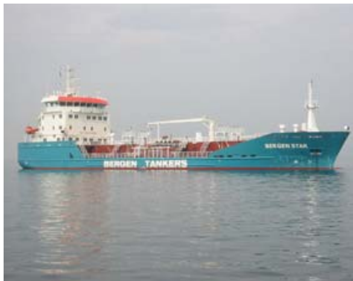
M/T Bergen Star

Oslo, Stavanger, Haugesund og Bergen. Dialogmøtet i Ålesund er utsatt til 11. mai.