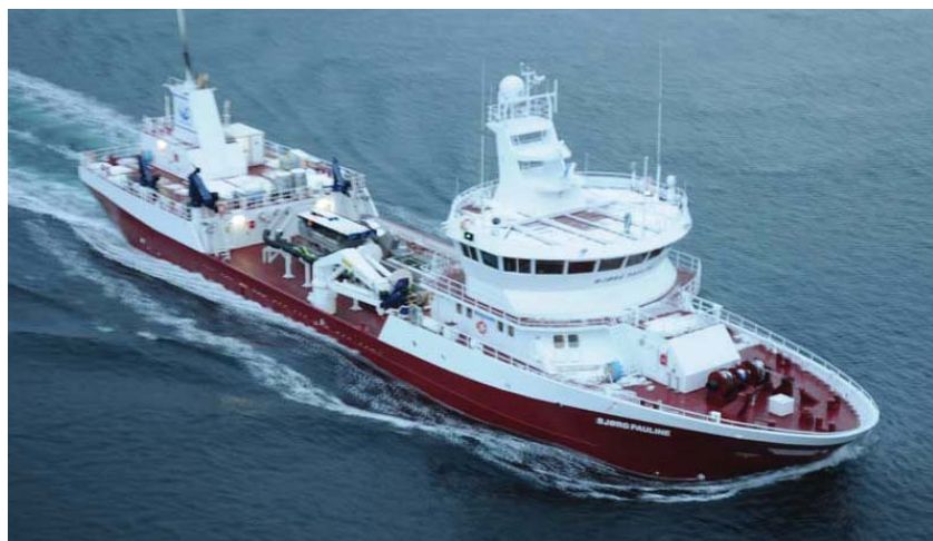
B/B Bjørg Pauline, Tilhørende Nordlaks Transport AS