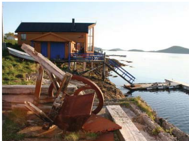
Fra Fleinvær i Gildeskål

Olav Kyrresgt. 11 | 5014 Bergen | Tlf. +47 55 21 52 00 | bergen@wr.no